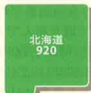
地域別最低賃金マップ